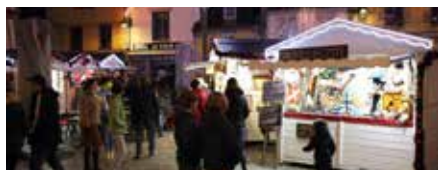
Quimper Bretagne Occidentale

Retrouvez également une cabine photo vintage (infos p.4) !