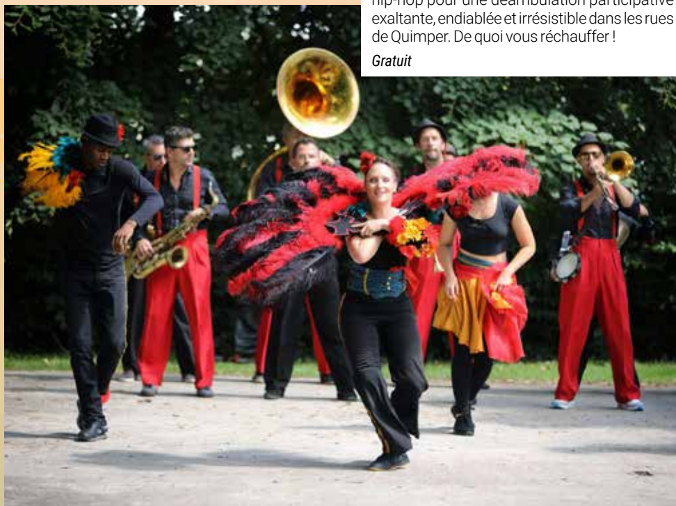
Red Line Crossers / Engrenage[s]