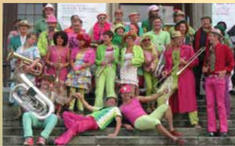
A bout de souffle