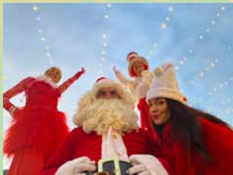
Cie Y'a un trou dans l'mur