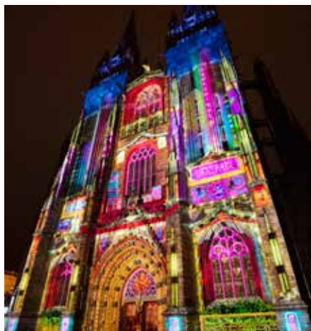
Quimper Bretagne Occidentale