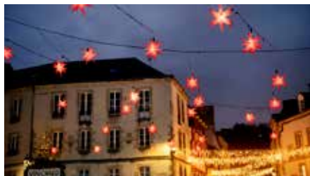
Quimper Bretagne Occidentale